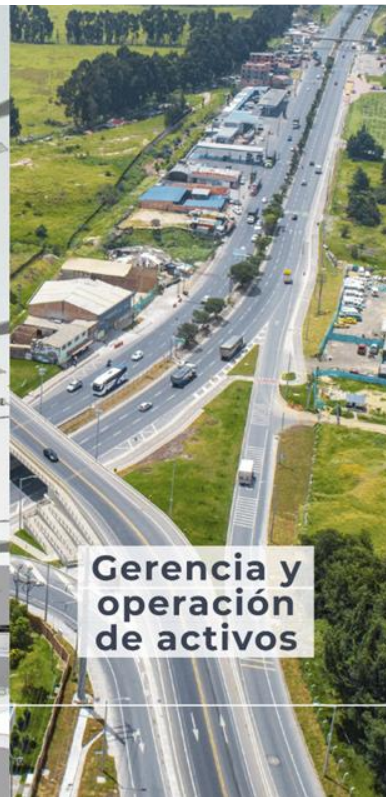
Gerencia y operación de activos