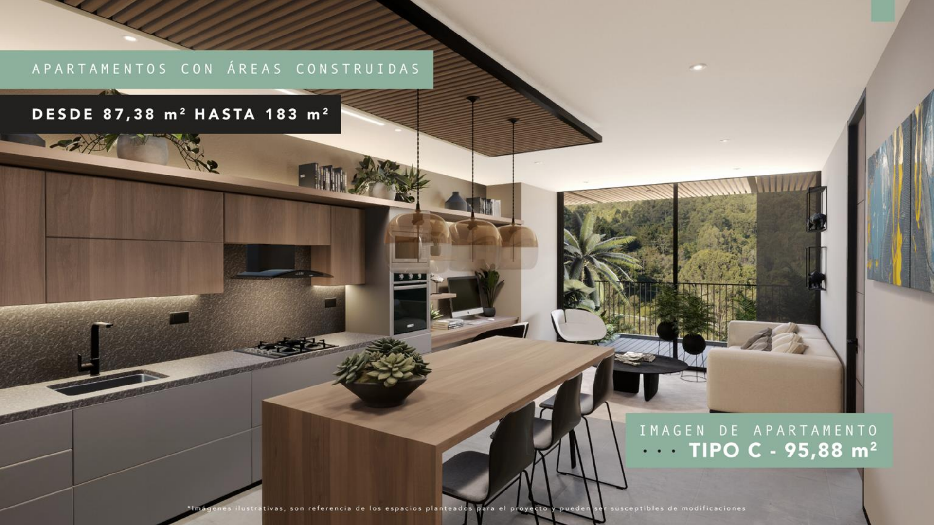
IMAGEN DE APARTAMENTO • • • TIPO C - 95,88 m 2

*Imágenes ilustrativas, son referencia de los espacios planteados para el proyecto y pueden ser susceptibles de modificaciones