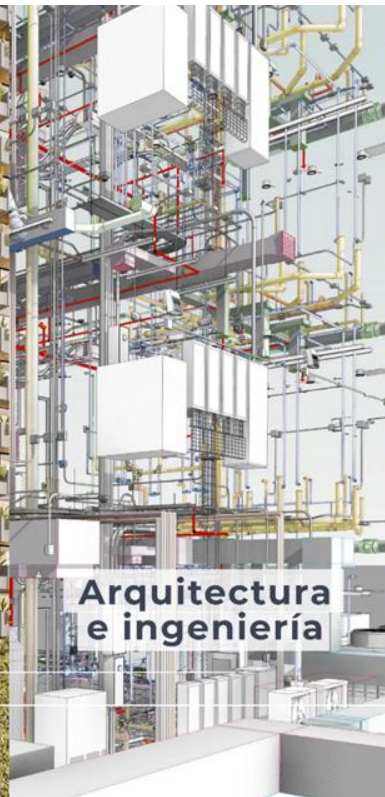
Arquitectura e ingeniería